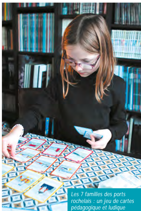
Les 7 familles des ports rochelais : un jeu de cartes pédagogique et ludique

Filières de premier plan, les activités maritimes rochelaises de commerce, de pêche et de plaisance font actuellement l'objet d'une étude socio-économique. Son objectif : évaluer le poids des ports en termes de valeur ajoutée sur le périmètre de la Communauté d'Agglomération,