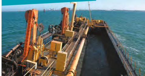
Immersion des sédiments portuaires sur la zone du Lavardin

Cette nouvelle autorisation a évolué par rapport à la précédente. Elle inclut la réponse aux besoins d'entretien postérieurs aux aménagements Port Horizon 2025, comme les futures souilles et zones d'évitage des quais de Chef de Baie 4 et de l'Anse Saint-Marc 3. La zone d'immersion demeure la même : Le Lavardin. D'autres options avaient été envisagées à l'instar du traitement des sédiments à terre, mais non retenues pour des raisons environnementales et technico-économiques.